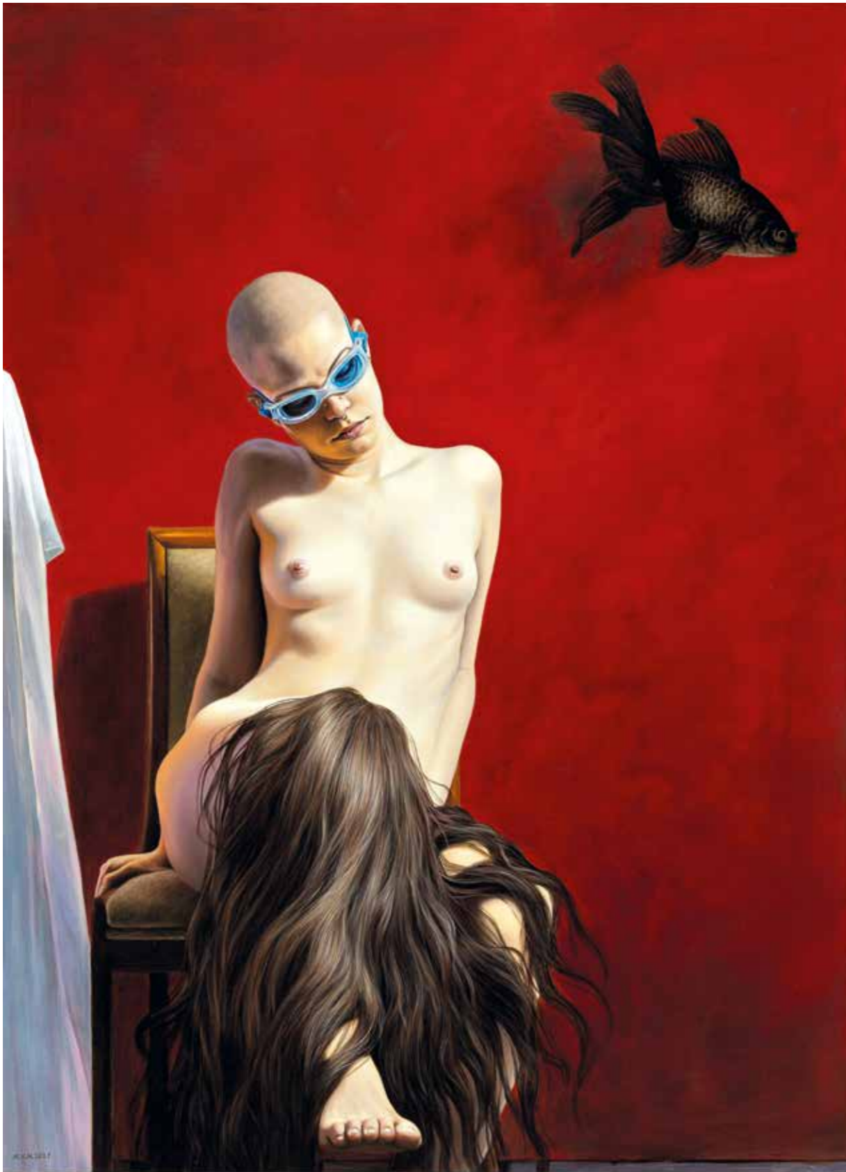
Almost Empty, 2021, oil on canvas, 137 × 100 cm