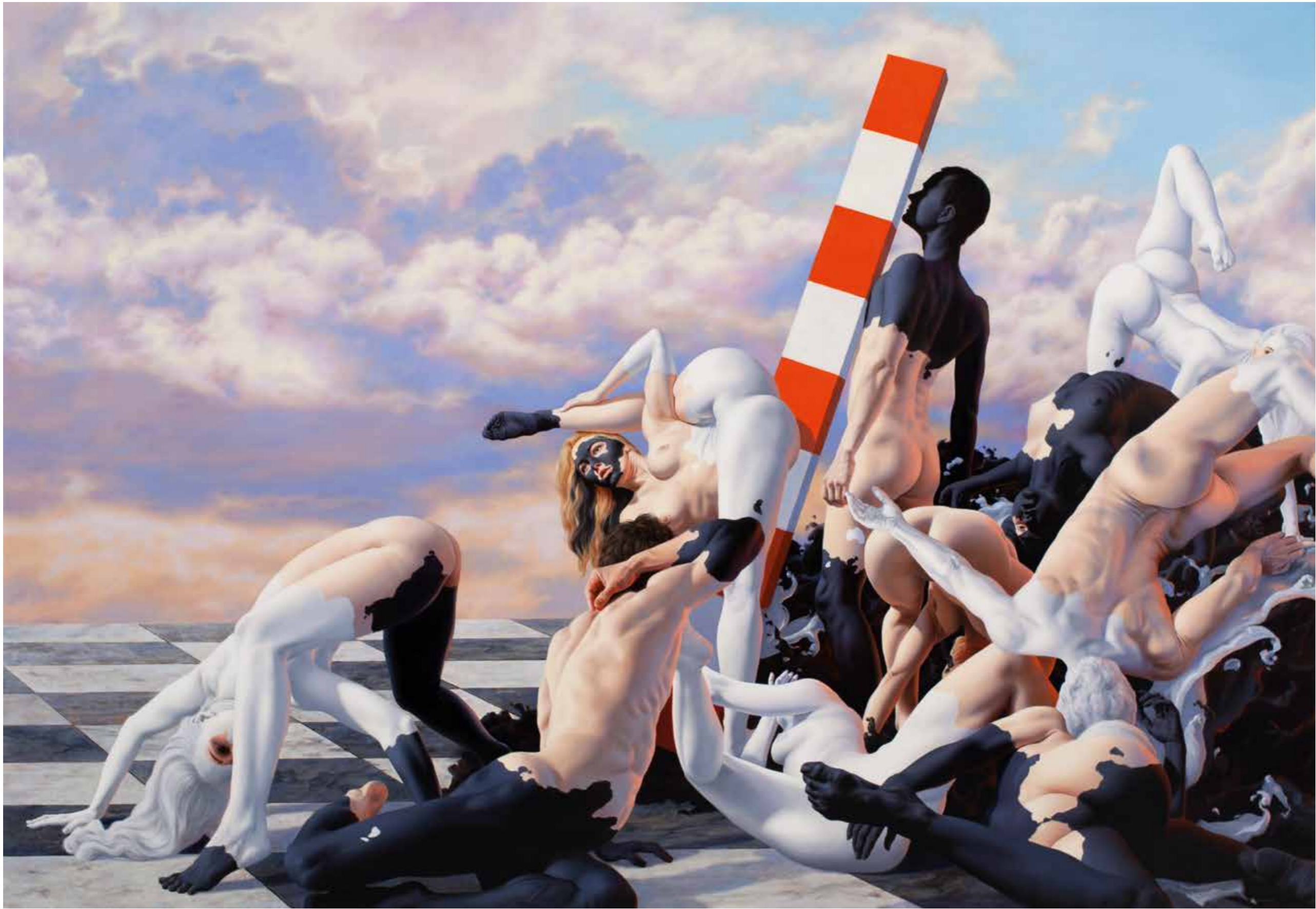
Exercises, 2022, oil on canvas, 207 x 300 cm